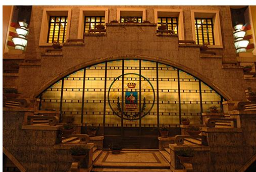
luminose realizzate dai giovani del progetto sociale "Accendi il tuo Futuro" per